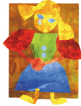
Förderverein Kinderklinik der Diakonie e.V.